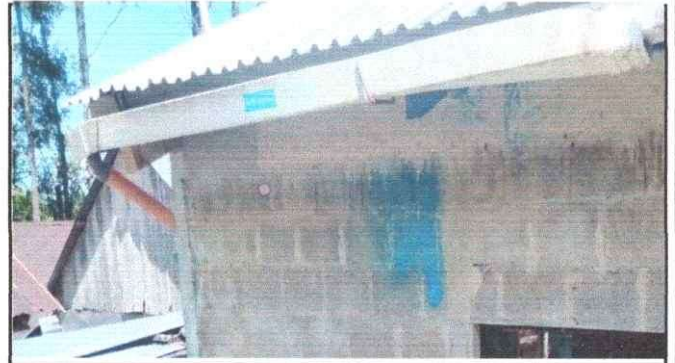
Foto 4: Sustitución de canales de metal ya que se encuentran en mal estado