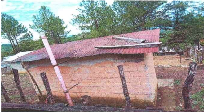
Foto 1: Sustitución de lamina de baños se encuentran en mal estado