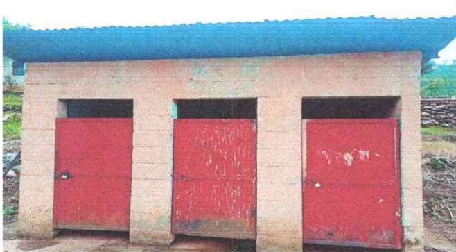
Foto 3: Sustitución de puertas de baños se encuentran en mal estado